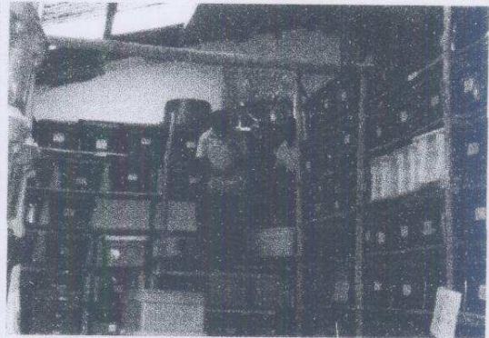
Actividades en el laboratorio de Yaxha