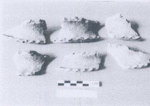
Ejemplares del Tipo Cerámico Manteca Impreso